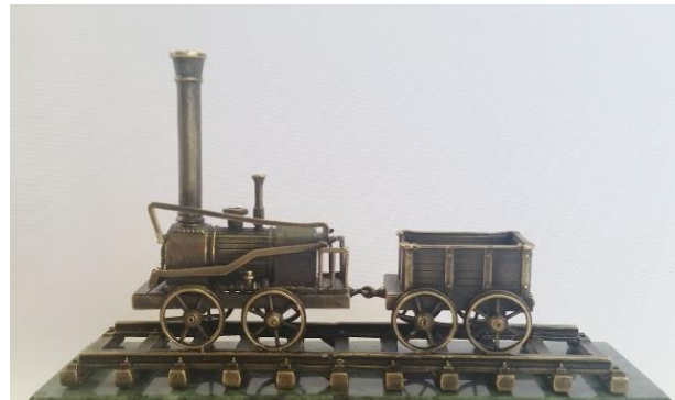
Модель паровоза Черепановых

Первой железной дорогой в России считается дорога из Санкт-Петербурга в Царское село, открытая в 1837 году. Для неё купили английский паровоз, хотя за три года до этого уральские изобретатели Ефим и Мирон Черепановы построили свой, русский, паровик не хуже английского. Он возил руду с медного рудника на завод в Нижнем Тагиле. Но об этом изобретении ничего не знали в Петербурге!