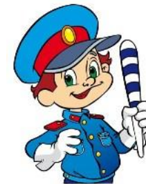
СХЕМА безопасных маршрутов учащихся к МОУ СОШ № 11